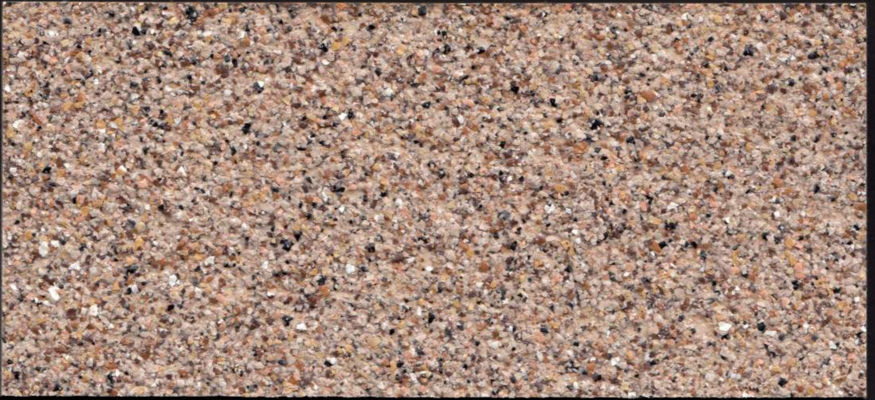
Piedra País / Country Stone / Pierre du Pays / حجر بلد