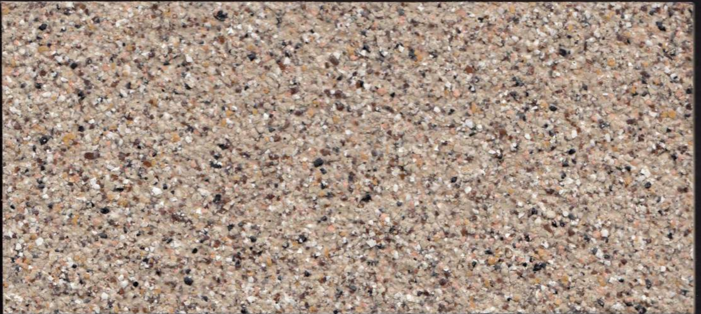
Piedra Oscura / Dark Stone / Pierre Obscure / حجر غامق