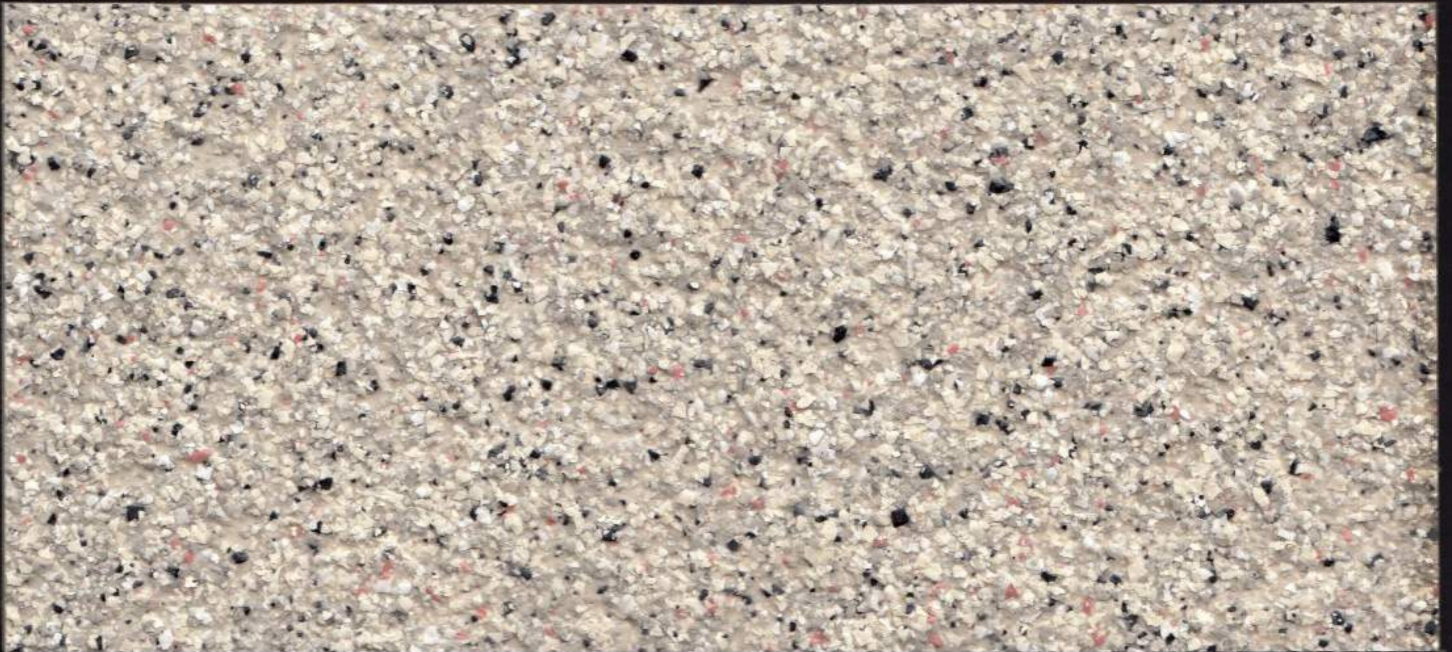
Piedra Clara / Light Stone / Pierre Claire / حجر فاتح