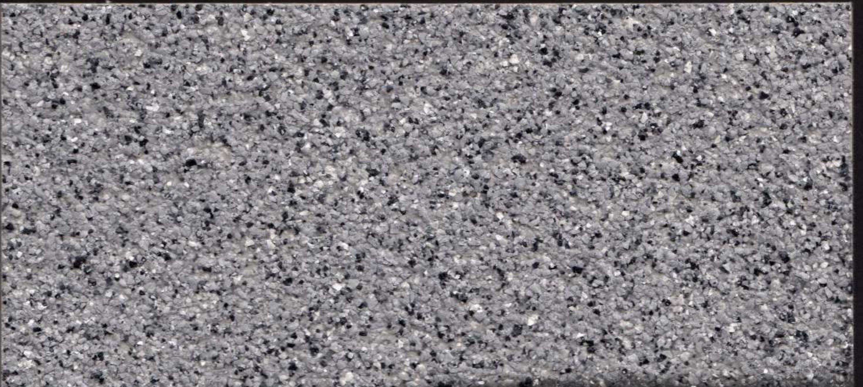
Piedra Gris / Grey Stone / Pierre Grise / حجر رمادي